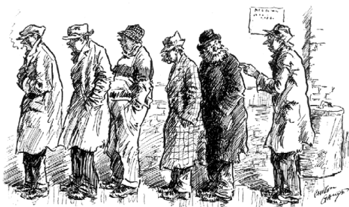
"Scuse me, Buddy, is this the bread-line or a run on a bank?"